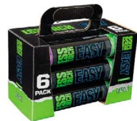
6-ne pakend 290 ml